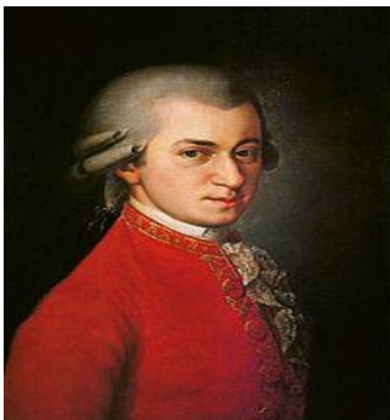
WOLFGANG AMADEUS MOZART (1756-1791 Austria)

Sin embargo, su mejor amigo fue el joven prodigio Mozart, veinticuatro años menor que él. Fue profesor de Beethoven, pero no llegaron a congeniar. Su talento maduró lentamente y fue modelo de la evolución del lenguaje artístico. Su música se caracteriza por su buen humor y picardía, aunque también ha creado pasajes de gran profundidad. Su amplio catálogo abarca 108 sinfonías, 68 cuartetos de cuerda, 47 sonatas para piano, 26 óperas, algunas misas y un Stabat Mater.